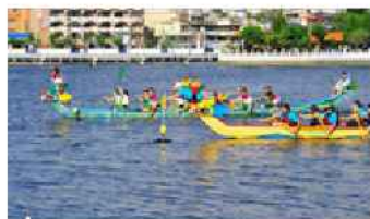
▲ 龍舟賽選手們奮力奪標

桃園市昔有「千陂之縣」、「千塘之鄉」的美譽，特殊的「陂塘」地理景觀聞名各地，原名「菱潭陂」的龍潭觀光大池，是凱達格蘭族霄裡社通事「知母六」與客家人共同興築而成，在龍潭觀光大池舉行的龍舟競渡活動已經有超過百年的歷史。