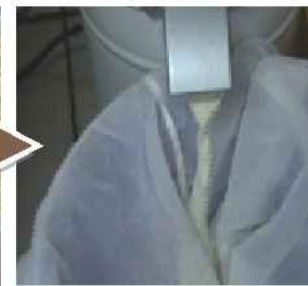
收集磨出來的豆汁