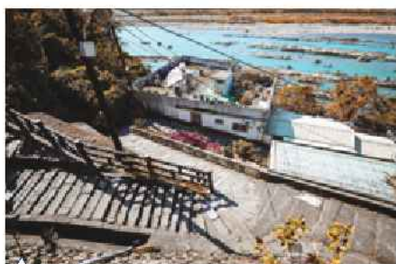
▲ 挑夫行走石板古道

大溪的地理位置靠山面河，自然景點和生態步道遍布，加上繁華的過去和豐富的人文，留下眾多精緻古老建築、古風遺址和古雅文物，舉凡古道吊橋、李騰芳古厝、慈湖與頭寮陵寢、齋明寺、蓮座山觀音寺與中華文化意涵與西洋巴洛克圖騰藝術交融的老街群牌樓，均是名聞遐邇的旅遊景點。