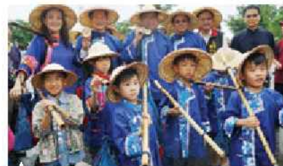
▲ 老中青三代一同挑聖蹟

本市共有6處聖蹟亭(龍潭聖蹟亭、大溪蓮座山觀音寺敬聖亭、大溪齋明寺聖蹟亭、中壢聖蹟亭、龜山大湖福德宮聖蹟亭、蘆竹五福宮聖蹟亭)，為傳承客家文化敬字惜紙的美習、緬懷倉頡先師造字之神聖，規劃辦理「送聖蹟禮生培訓工作坊」、「送聖蹟儀式」及「桃園聖蹟亭巡禮」等活動，帶領民眾探訪客家鄉親敬惜字紙文物古蹟，加深民眾對文化資產保存維護的體認，期帶動更多人來認識客庄文化重要資產—聖蹟亭。