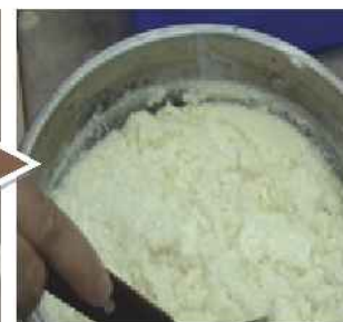
將凝固完成的豆腐腦打散