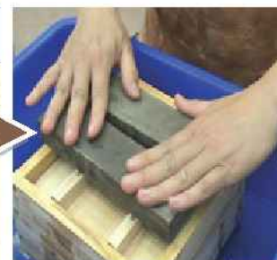
加蓋後放上石頭將水壓乾散