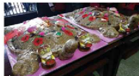
▲米糕做成的長壽龜