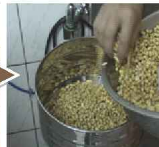
泡過水的黃豆，準備磨汁