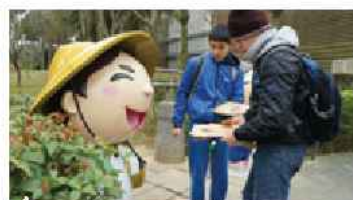
▲2017「桃趣祭天穿」實境解謎補天任務

農業時代，客家族群相當重視「天穿日」，當天男不耕田，女不織布，以唱歌跳舞方式歡度慶祝，並藉此感謝上天；以現代觀點來看，「天穿日」的意義在於適度給予大自然休養恢復的時間，體現讓環境生生不息、資源永續發展的精神。