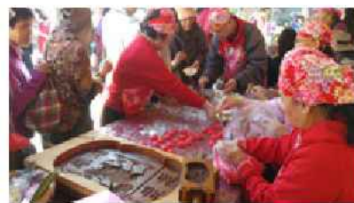
▲「祖孫共同動手做甜粿活動」盛況

俗語說「有賺無賺，總愛祭天穿；有做無做，祭到天穿過」。「天穿日」是客家族群獨有的文化節慶。舊時相傳水神與火神相爭，將天撞出一個大洞，女媧為免去人間災苦，於是煉五色石補天，這就便是「天穿日」的由來。