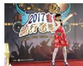
▲參賽者演唱童謠歌曲「看桐花」

桃園市有全國最多客家音樂出版公司、客家歌曲、影音工作室、獨立創作人等，樂風鼎盛。而每年於3月至5月舉行的客家流行音樂節，總是吸引來自各地之客家鄉親、非客家族群(如新移民、外籍僑生、閩南人口等)踴躍報名，讓海內外民眾以歌會友、切磋交流、凝聚情誼，也印證音樂具有跨越年齡與國籍的文化魅力。