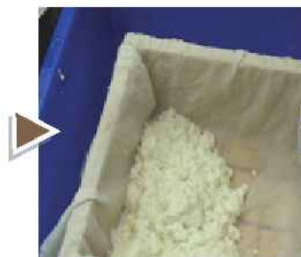
將豆腐腦舀入模具