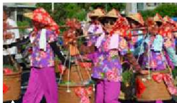
▲ 挑擔奉飯、踩街遊行活動

為傳承與延續新埔枋寮客家精神的義民精神，凝聚桃園平鎮義民廟慎終追遠、慶祝豐收的氛圍，桃園市每年都會規劃客家義民祭典文化節系列活動，藉以緬懷客家先烈情操，保存客家特有文化的認同感。