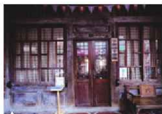
▲ 下街四十番地工房