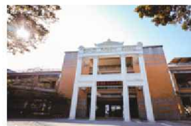
▲ 大溪國小巴洛克牌

西元1897年，日本人在台北芝山岩開設「台北國語傳習所」，從事台日語的翻譯研究，當時的所長木下邦昌到大溪視察，地方仕紳呂鷹揚、呂建邦等人，把握機會提出設校構想，幾經斡旋，在11月6日核准設立「台北國語傳習所大崙崁分教場」，並在中山路借用民房修繕當作校舍，這是大溪國小設立的起源。