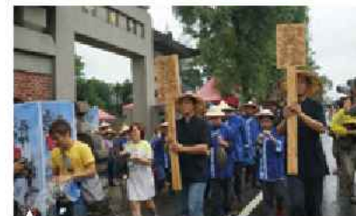
▲ 桃園龍潭送聖蹟儀式