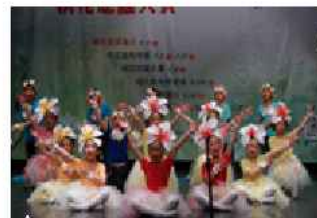
▲桐花舞蹈大賽精彩表演