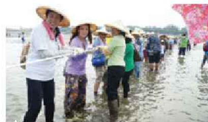
▲ 民眾一同體驗牽罟活動

眾人待漁網撒好，魚群被圍住後，利用人力將漁網往後拉至岸上的捕魚方法，是先民發展諸多智慧，集合眾人之力方得完成的漁撈活動。為了重拾以往傳統漁法，舉辦牽罟體驗，感受客家漁村特有捕魚方式，呈現漁村互助合作精神，也教育傳承給下一代。