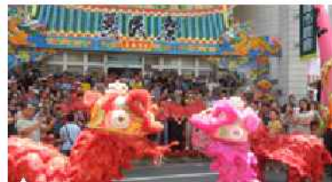
▲ 義民祭現場熱鬧滾滾