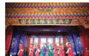
▲ 客家採茶劇團精采演出

「桃園客家文化節」辦理的時間，正好配合每年農曆八月客家庄秋收時節，客家人在入秋作物豐收後，為了答謝天地眾神的庇佑，除了會準備豐盛祭品進行祭祀，也會請野台戲劇團到神明面前獻演「平安戲」，來表達酬謝之意。在桃園市的許多客庄，八月時也會敬拜伯公、做平安戲。