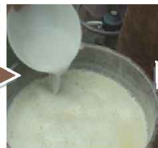
放入鹽滷，使它凝固成豆腐腦