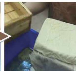
從模具取出完成熱騰騰的豆腐