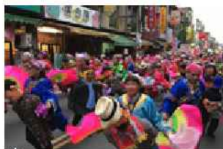
▲地方社團組成隊伍參加迎財神踩街活動

龍潭「迎財神」是客庄十二大節慶之一，起源於日本時代，原為鄰居之間互相揶揄對方的農暇活動，發展至今已成為每年桃園地區元宵節最熱鬧的踩街活動，各社區團體、地方社團及各級學校自發性參與，展現創意。