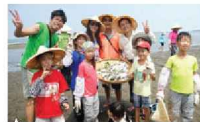
▲ 牽罟的戰利品-各式各樣的漁獲