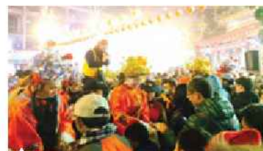
▲民眾換取財神爺發財母金盛況

活動另一個高潮是「龍元宮迎財神祈福繞境」，最特殊的地方在民眾用家裡的一元換財神爺手中的發財母金，象徵「舊金換新金，母金滾萬金」，期盼在過年期間得到財神爺的庇祐新的一年能財運亨通，保佑新的一年大發利市。