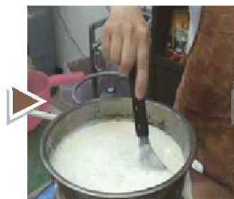
不斷攪拌，避免燒焦