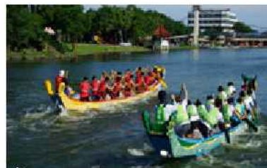
▲ 桐舟共渡歸鄉文化祭已有百年歷史

早期「桐舟共渡歸鄉文化季」是龍潭人歸鄉的日子，也是客庄十二大節慶之一。隨桃園市的升格已逐漸成為桃園市民的歸鄉日，並藉客庄節慶活動整合社區，資源讓遊客體驗客家陂塘文化生活、龍潭陂塘龍舟賽的特色傳統。近幾年活動廣邀國際人士組隊參賽，希望打造全球陂塘龍舟賽口碑，傳揚客家陂塘文化之精神，讓龍潭觀光大池蛻變成眾人皆欲往朝聖的歸鄉聖地。