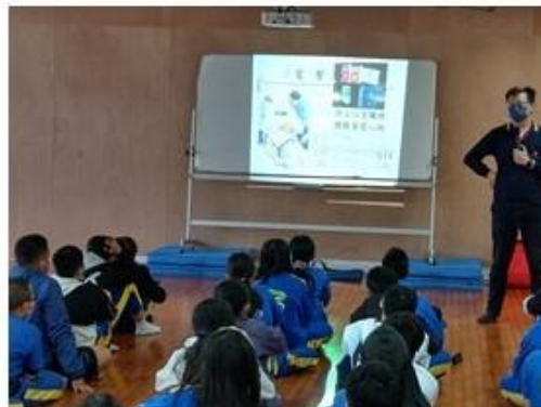
說明：心肺復甦術技術操作說明