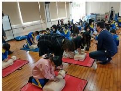
說明：心肺復甦術操作演練