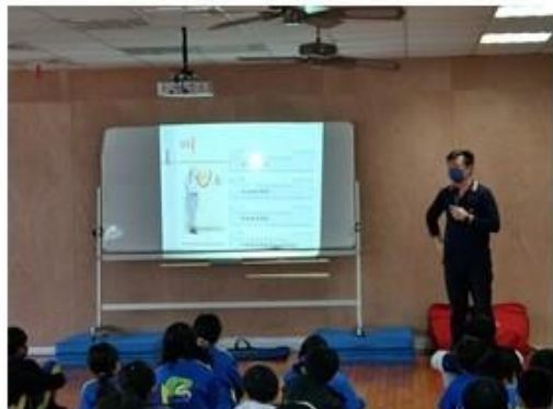
說明：心肺復甦術技術操作說明