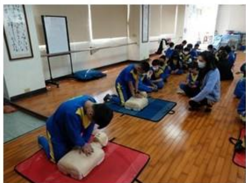
說明：實際操作演練急救過程