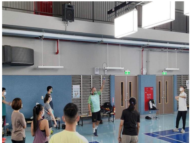
晶幣榮譽護照獎勵學生正向健康行為