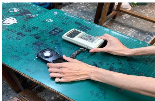
使用數位照度計偵測教室內照明度